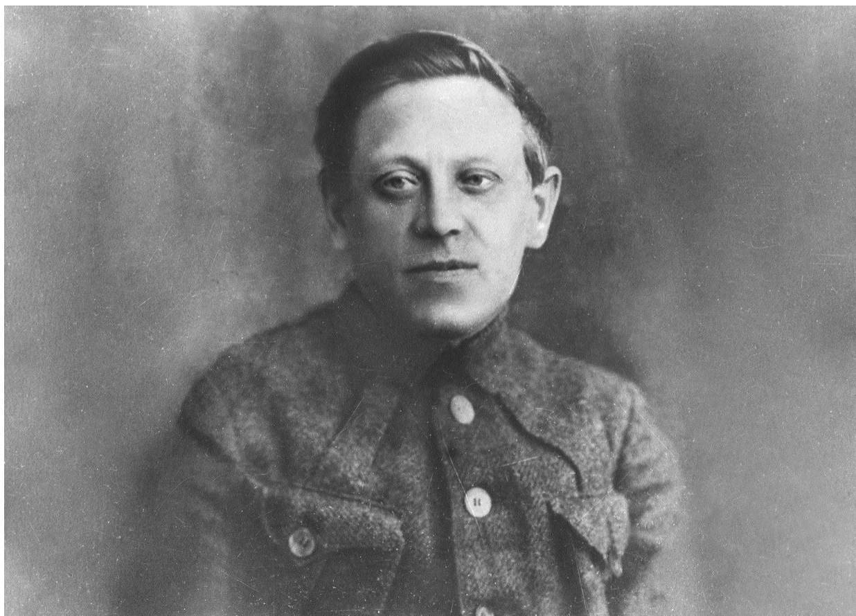
Der ukrainische Militärangehörige und Politiker, Leiter des Direktoriums der Ukrainischen Volksrepublik in den Jahren 1919 und 1920, Simon Petljura (1879 bis 1926)

Nach dem Tod ihres Anführers gründeten die ukrainischen Nationalisten, denen die Flucht ins Ausland gelungen war, mehrere radikale Organisationen. Am 28. Januar 1929 trafen sie sich in Wien zum Kongress der Ukrainischen Nationalisten, auch bekannt als Erste Große Versammlung. Sie beschlossen, für die Unabhängigkeit der Ukraine von der UdSSR zu kämpfen, mit dem Ziel, eine "nationale Diktatur" zu errichten. Die Teilnehmer erklärten die Organisation der Ukrainischen Nationalisten (OUN) und wählten den ehemaligen österreichischen Offizier und Petljuras Verbündeten Jewgeni Konowalez zu ihrem Vorsitzenden. Der Kongress endete am 3. Februar.