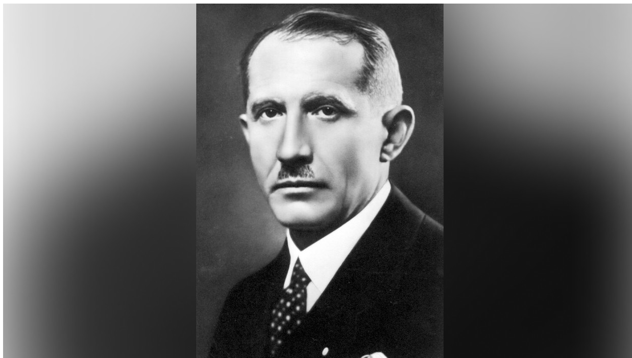
Jewgeni Konowalez, militärischer Befehlshaber der Ukrainischen Volksarmee und politischer Führer der ukrainischen nationalistischen Bewegung

wurde der OUN-Anführer von einem Agenten des Volkskommissariats für innere Angelegenheiten (NKWD), Pawel Sudoplatow, getötet.